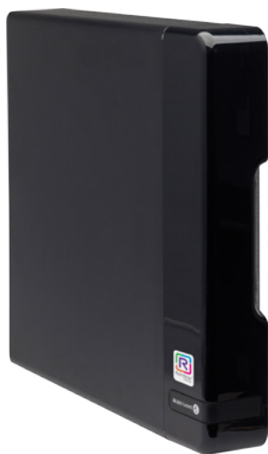
OXO Connect Compact Edition

Pour être compétitif et réussir sur le marché actuel, les petites et moyennes entreprises (PME) ont besoin de produits spécifiquement développés pour les entreprises. Simple, robuste, connecté et au juste prix, l'offre OpenTouch Suite pour PME d'Alcatel-Lucent aide les entreprises à prospérer.