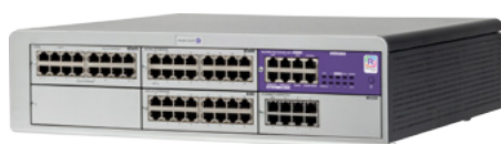
OXO Connect Medium