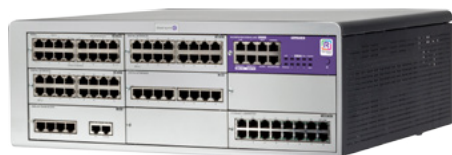
OXO Connect Large

L'offre OpenTouch® Suite pour PME d'Alcatel-Lucent est construite sur le serveur de communication de nouvelle génération, nommé OXO Connect. OXO Connect est la nouvelle version hybride de l'OmniPCX® Office RCE. OXO Connect, serveur robuste destiné aux PME, a désormais une capacité étendue à 300 utilisateurs. De plus, OXO Connect est prêt à être connecté dans le cloud afin de fournir des services à valeur ajoutée aux PME.